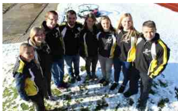
Mannschaftsschützen 2019 1. Liga