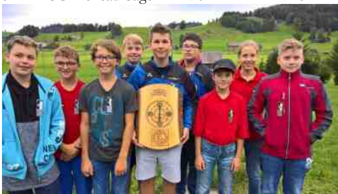
Die zweiten StS. Teufen, Sieger FSG Reute, und dritte FSG Heiden 1.