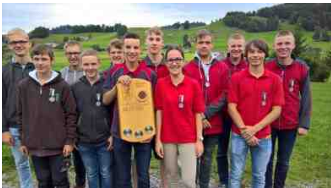
Zweiten Rang StS. Teufen, Sieger FSG Heiden 1, und dritter Rang FSG Heiden 2.

Gleiche Programm für die Jugendschützen aber nur drei Schützen pro Gruppe. In der ersten Runde machte FSG Reute 1 einen starken Eindruck und erreichten 240 Punkten, gefolgt von FSG Heiden 1 und FSG Heiden 2 mit je 228 Punkten und StS. Teufen mit 221 Punkten Die Gruppe aus Herisau-Säge hatte schon 39 Punkte Rückstand auf FSG Reute 1. Im zweiten Durchgang boten die Jugendschützen aus Reute mit 252 Punkten eine super Leistung, schossen sie 12 Punkte mehr als in der ersten Runde.