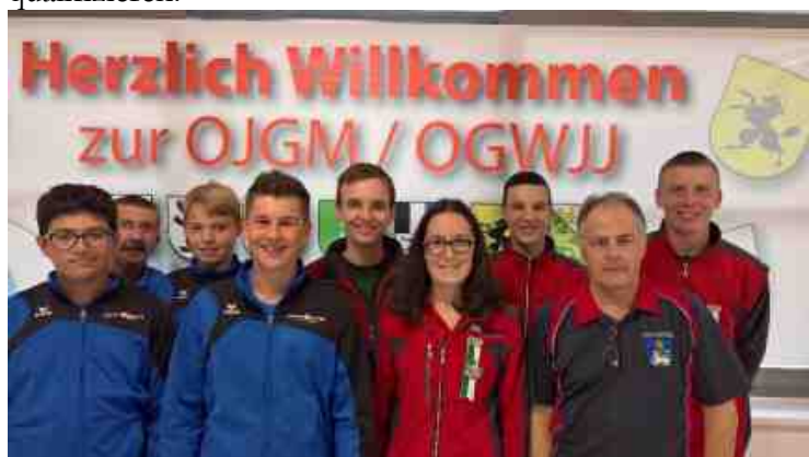
Teilnehmer KSV-AR, Reute FSG mit JJ U15 Gruppe und Heiden FSG JS U21 Gruppe.

Sie qualifizierten sich im 10. Rang mit 492 Punkten für den Ostschweizer Gruppenfinal. Die Jugendschützen aus Reute waren erst zum zweiten Mal an einem Wettkampf ausserhalb des Kantons. Sie zeigten jedoch eine ausgezeichnete Leistung und erreichten mit 484 Punkten den 14. Rang. Dieses Resultat wird leider nicht ausreichen, um sich für den Final in Emmen zu qualifizieren.